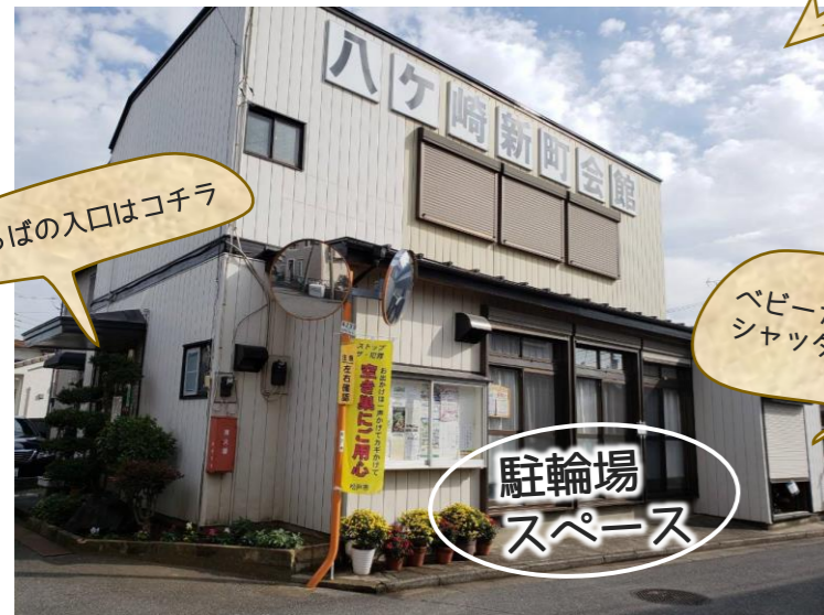
駐輪場・ベビーカー置き場の拡大